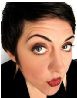
EMANUELA GRIMALDA MIDOLLA E ANIMELLE Regia di Massimo Andrei

sabato 31 luglio, ore 21,30 – SONCINO (Cr) Piazza del Comune. In caso di pioggia Ex Filanda